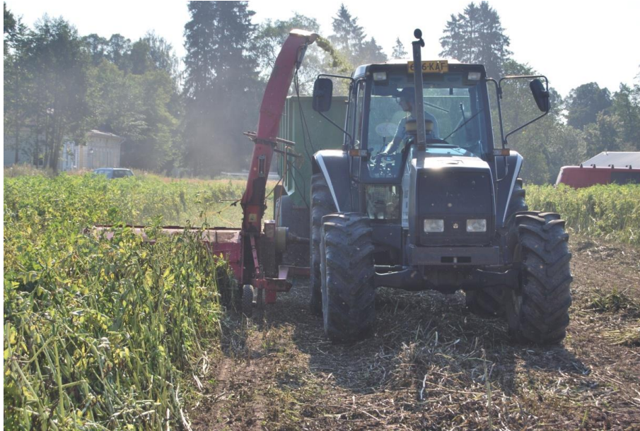
Kuva 2. Härkäpavun toisena korjuukoneena oli kasvustoa suoraan niittävä kaksoissilppuri, jonka työleveys oli 1,7 m.

Samana päivänä kello 13 tienoilla edellisenä päivänä niitetyt karhot paalattiin Krone Comprima V 150XC muuttuvakammioisella pyöröpaalaimella (Kuva 3.), jossa paalin halkaisijaa voidaan säätää välillä 125 – 150 cm:ä. Halkaisija säädettiin siten, että paaleista tuli 145 – 150 cm:ä. Paalin leveys oli 122 cm. Paalattaessa ajonopeus oli 6 km/h. Paalaimessa oli verkkosidontalaite. Verkkoa kiedottiin 2,5 kierrosta paalia kohti. Paalaimen kaikki 26 vastaterää olivat käytössä. Paalajaan ajonopeus oli noin 6 km/h. Kiedontatraktorin etukuormaimessa oli hydraulipaineen mittaukseen perustuva vaaka, jolla paalit punnittiin. Paalit kiedottiin Elhon Softliner 1400 nostolaitesovitteisella kiedontalaitteella (Kuva 4.). Valkoinen muovikalvo oli leveydeltään 750 mm ja sitä kiedottiin 8 kerrosta paalia kohti.