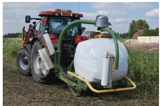
Kuvat 3 ja 4. Vuorokauden esikuivauksen jälkeen härkäpapukarho paalattiin ja paalit kiedottiin muovikalvoon.

Sää niittopäivänä ja seuraavana varsinaisena korjuupäivänä oli aurinkoinen ja erittäin lämmin, lämpötila päivällä oli 25 – 30 °C. Tuuli oli alle 5 ms -1 .