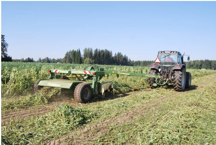
Kuva1. Härkäpavun niitto hinattavalla niittomurskaimella, jonka työleveys oli 3,2 m. Koneen murskainosa oli varstatyyppinen V-mallisin sormin varustettu.

Elokuun alussa 2014 tehtiin härkäpavun korjuukoe Hämeen ammattikorkeakoulussa Mustialan opetus- ja tutkimusmaatilalla. Koelohkoilta korjattu kasvusto oli Kontu-lajike, joka oli kylvetty 15.5. ja 22.5. . Suoraa kasvustoa niittävänä ja silppuavana korjuukoneena oli Luoko-Junkkari-kaksoisilppuri. Toisena koneetjuna oli Krone EasyCut 3210 CV-niittomurskain jonka työleveys oli 3,2 m (kuva 1), Krone Comprima -pyöröpaalain ja Elhon kiedontalaite